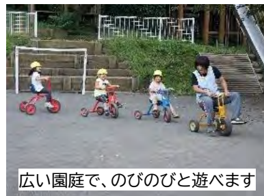
広い園庭で、のびのびと遊べます