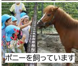
ポニーを飼っています