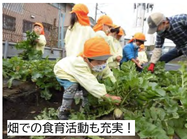
畑での食育活動も充実!