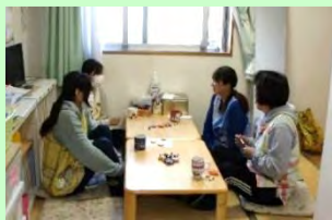
休憩室あり→ 交代で休憩をとっています。和気あいあいとした楽しい職場です◎

職員の有給休暇取得数を管理簿により把握し、有給休暇取得を推進しています。また、関連書類の統一・削減などによる書類の見直し、ICT活用による作業の効率化、行事内容の見直し、会議の昼実施や会議時間の短縮などに取り組んでいます。